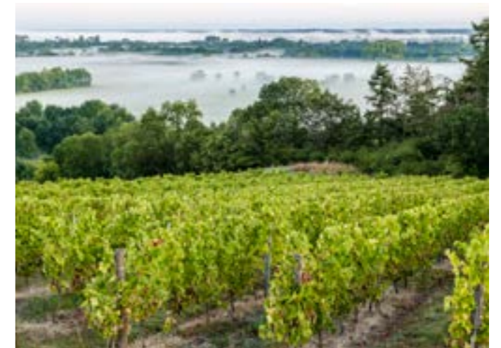
© Sébastien Gaudard - La Corniche Angevine

À Saint-Lambert-du-Lattay, ce musée retrace l'histoire de la viticulture et du métier de vigneron en Anjou . Les ateliers ludiques, visites guidées, conférences ou balades dans les vignes permettent aux petits comme aux grands d'apprendre et de se divertir.