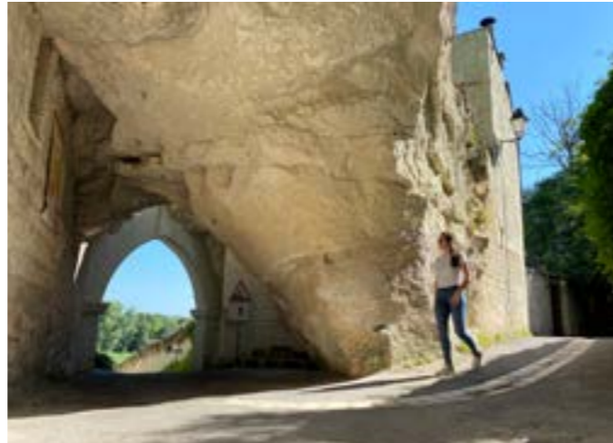
Rue du Commerce

Drôle de rue qu'est la rue du Commerce. Il ne s'agit pas d'un site touristique en soi, mais bien d'une rue. Située à Souzay-Champigny, proche de Saumur, elle peut s'emprunter à pied ou bien à vélo. Elle fait en effet partie des tronçons atypiques que les cyclistes de La Loire à Vélo aiment arpenter.