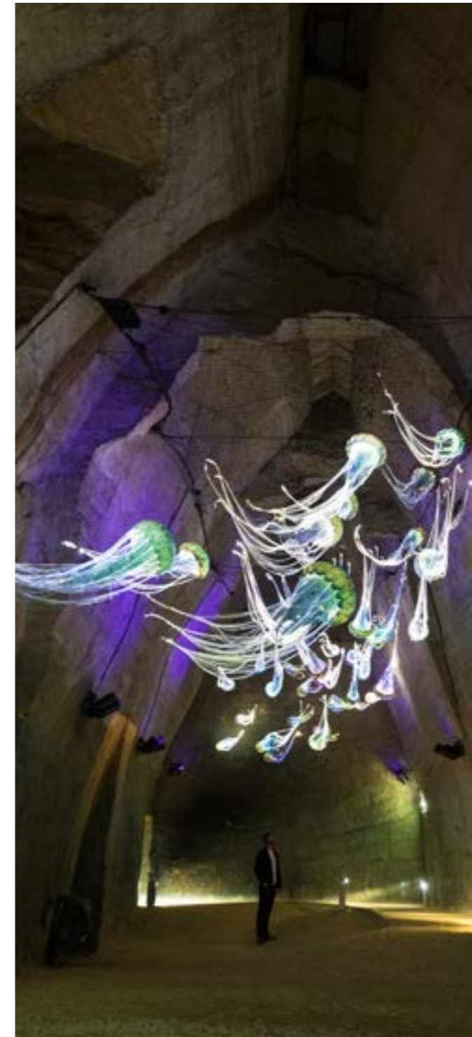
© Mathieu Génon - Le Mystère des Faluns

La mer des faluns n'a pas fini de nous livrer ses secrets. Dans une ancienne carrière de Douces, à Doué-en-Anjou, des archéologues ont découvert une fabrique de sarcophages datant de l'époque mérovingienne. Entre le V e et le X e siècle, plus de 35 000 tombeaux en falun ont été produits et exportés dans les autres régions françaises. Une véritable industrie funéraire.