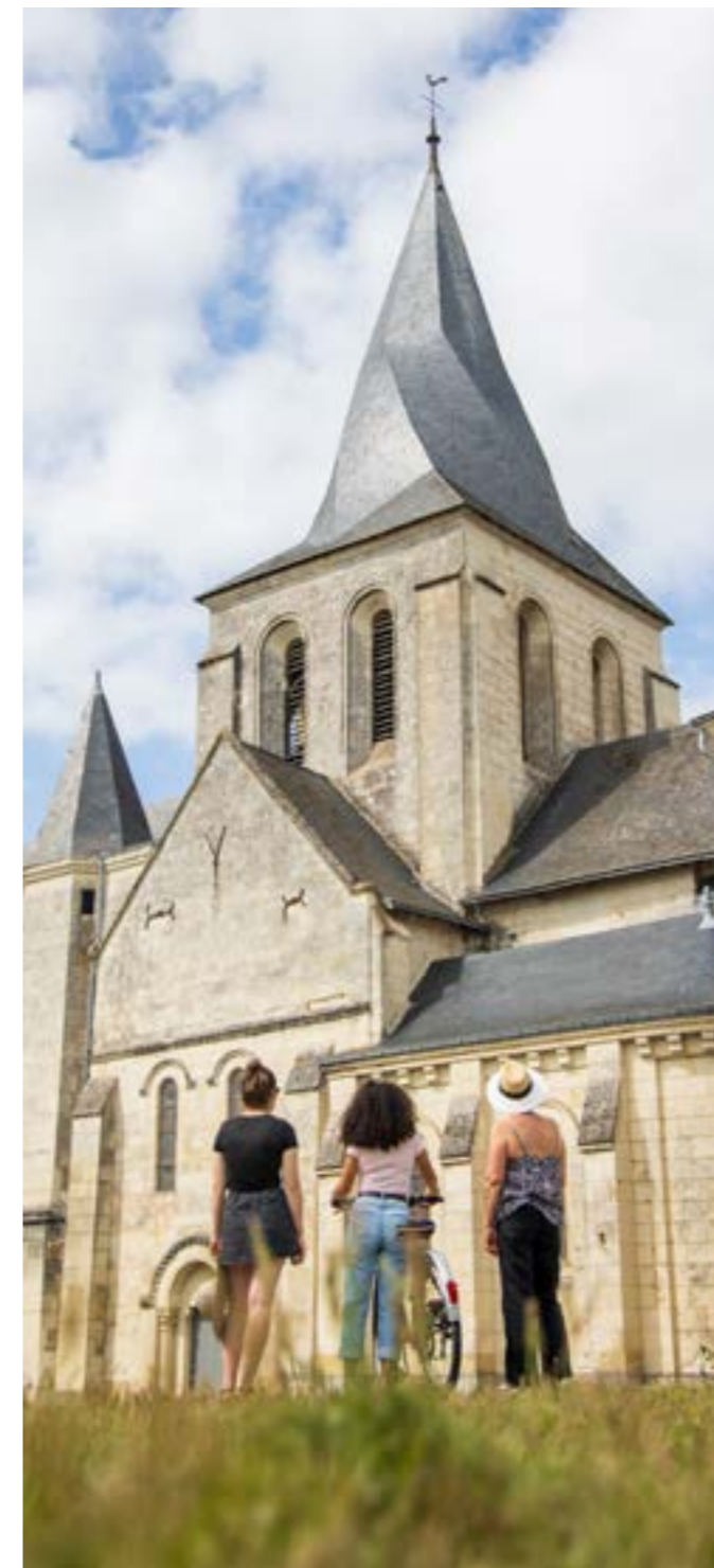
Clocher tors de l'église de Fontaine-Guérin