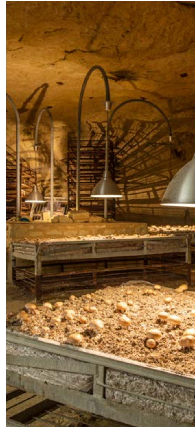
Champiognière du Saut aux Loups

Au plein cœur d'Angers ouvriront au printemps les Halles Gourmandes . Boulanger, fromager, poissonnier, caviste, primeur et autres métiers de bouche seront tous rassemblés dans ces nouvelles halles à deux pas de la Maine. Ici on pourra à la fois acheter de quoi remplir ses placards et déguster sur place des produits d'artisans locaux, issus d'un circuit court.