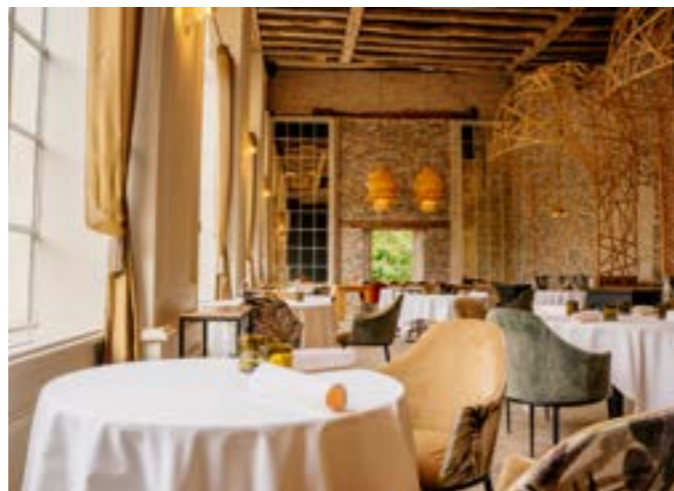
© Les Conteurs - Le 1825

1825 . Ce n'est pas le nombre d'étoiles dans le ciel angevin... mais le nom du restaurant qui a obtenu en 2022 sa première étoile au guide Michelin . Rattaché au Domaine de la Brulière, le Restaurant le 1825 La Table propose une cuisine savoureuse et gastronomique réalisée à partir de produits locaux. Restaurée, c'est dans l'orangerie du château qu'il est possible de s'attabler pour déguster les plats préparés par le Chef.