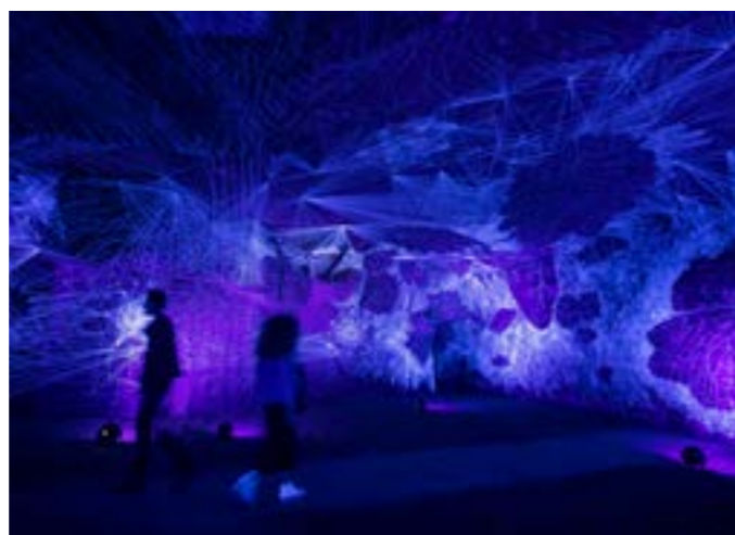
© Mathieu Génon - Œuvre de Julien Salaud : « Ecologia Naturotica »

Véritables ateliers hors du temps, les caves troglodytiques d'Ackerman accueillent chaque année un artiste en résidence. Depuis 2014, la plus ancienne maison de fines bulles de Saumur mène ce programme en partenariat avec l'Abbaye royale de Fontevraud et permet à des créateurs contemporains de s'emparer de cet univers exceptionnel pour proposer des œuvres... forcément extraordinaires!