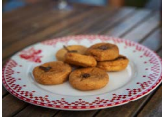
Pommes tapées

La production de pommes tapées , c'est-à-dire de pommes déshydratées pouvant être conservées plusieurs années, représentait une véritable industrie au XIX e siècle. Prisées des mariners de Loire , elles peuvent toujours se déguster aujourd'hui, réhydratées dans du vin ou du jus de pomme. Dédié à leur fabrication, le musée troglodytique des Pommes Tapées du Val de Loire situé à Turquant permet de visiter les anciennes salles de fabrication.