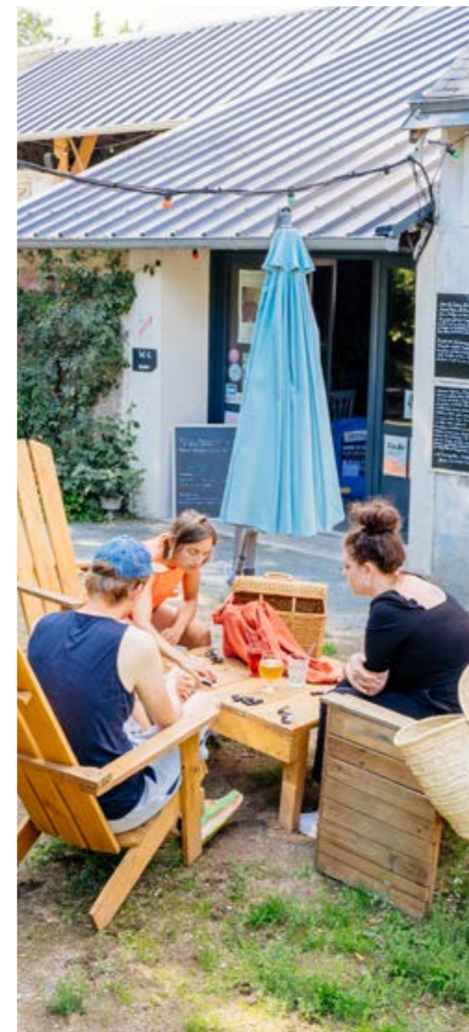
Guinguette au bout de l'île

Sur l'île la plus longue de Loire, cette guinguette des bords de Loire, labellisée Ecotable s'appuie sur les valeurs communes de respect de l'environnement, du bien manger, de partage et de rencontre. Convivialité, développement durable, seconde vie, produits locaux, circuits courts, bio fondent l'esprit de la guinguette de Véronique, Jean-Jacques et de leurs enfants, Louise et Alexandre.