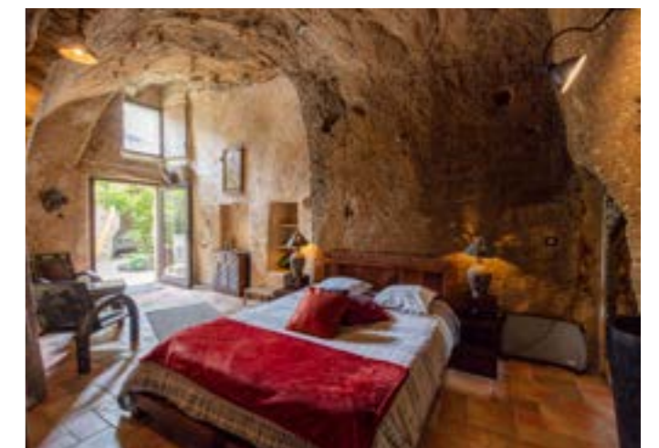
© David Darrault - Farfadine et Troglos

Au cœur de leur matériau de construction, le tuffeau, les plus belles églises, villes et villages du Val de Loire ont été sculptés minutieusement à l'échelle: un hymne à la beauté du travail des bâtisseurs.